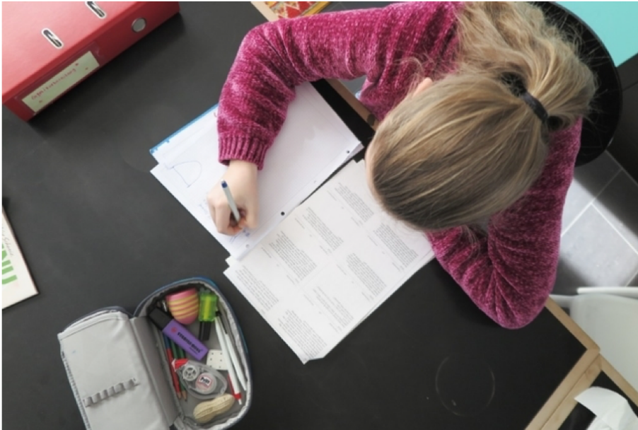
Jetzt fängt es erst an: Angehende Gymischülerin beim Lernen.

Nach der Aufnahmeprüfung kommt die Probezeit: Hier wird nochmals gefiltert – je nach Schule unterschiedlich stark.